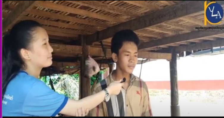
ការជួយជាកញ្ចប់ស្បៀងដល់សិស្សនៅ កូរ៉េ ១៩ https://www.youtube.com/watch?v=UvgLhRRaqho