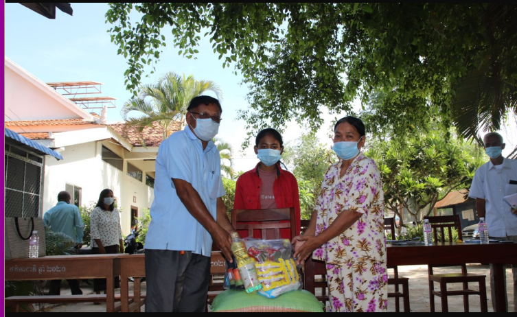
ការជួយជាកញ្ចប់ស្បៀងដល់សិស្សនៅកូរ៉េ ១៩ https://www.youtube.com/watch?v=UvgLhRRaqho&t=21s