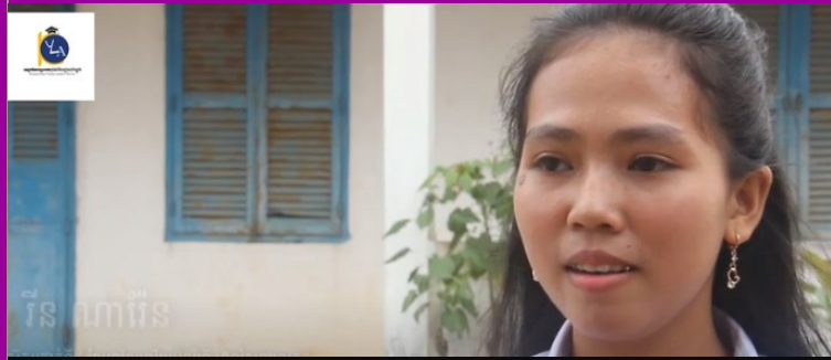
អត្ថប្រយោជន៍នៃការចូលរួមវគ្គបណ្តុះបណ្តាលពីគម្រោង https://www.youtube.com/watch?v=ecUvnzjH2Hc&t=1s